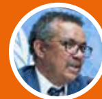
DR. TEDROS ADHANOM GHEBREYESUS

directeur-generaal van de Wereldgezondheidsorganisatie (in reactie op een vraag van Viva Salud over de mensenrechten tijdens de coronapandemie)