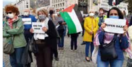
31 augustus 2020: 150 personen manifesteerden coronaproef tegen de Israëlische bombardementen op Gaza.

Onder het motto 'Steun de strijd tegen corona wereldwijd' brachten we de strijd tegen corona in onze partnerlanden Congo, de Filipijnen, Palestina en Cuba onder de aandacht. Met tal van organisaties en sociale bewegingen riepen we onze regering op om van het coronavaccin een wereldwijd gemeenschappelijk goed te helpen maken. Want iedereen verdient bescherming. We wezen ook op het belang van een sterke openbare gezondheidszorg die geen onderscheid maakt tussen arm en rijk. Gezondheidszorg in publieke handen is ook de beste garantie op een efficiënte aanpak van een gezondheids crisis zoals de coronapandemie.